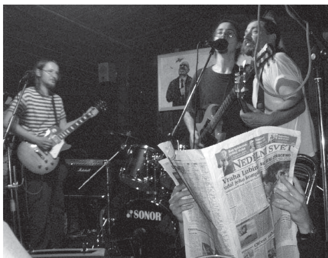
Pražská kapela Nedělní lidé, opravdu sváteční zážitek