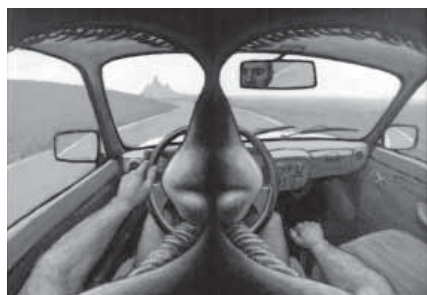
L. D., Autoportrét, akryl, 51 x 72 cm, 2000

Lubomír Dostál (1950), narozen v Brně, žije v Horní Loděnici u Moravského Šternberka. Už v osmdesátých letech Jiří Olič charakteristicky rozlišil: „Jsou umělci, kteří se zdají, a jsou umělci, kteří jsou.“