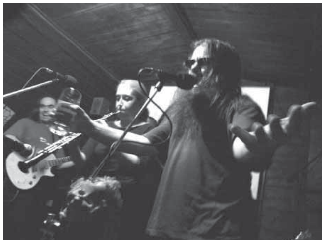
Pražští BBP – neúnavná snaha o undergroundovou kontinuitu