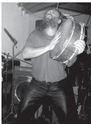
Přerovská Stará dobrá ruční práce

ZÁVIŠ (Znojmo) – pátek 19.00 – „kníže moravského porno-folku“, postava neodmyslitelně spjatá s otřískanou španělkou, s níž putuje od města k městu a rozsévá své přisprostlé, leč vtipné verše. Zastoupen na sampleru Czech Underground vol. 2 . Vydal sedm desek a několik knih. Rovněž miláček celebrit a oblíbenec Karla Gotta.