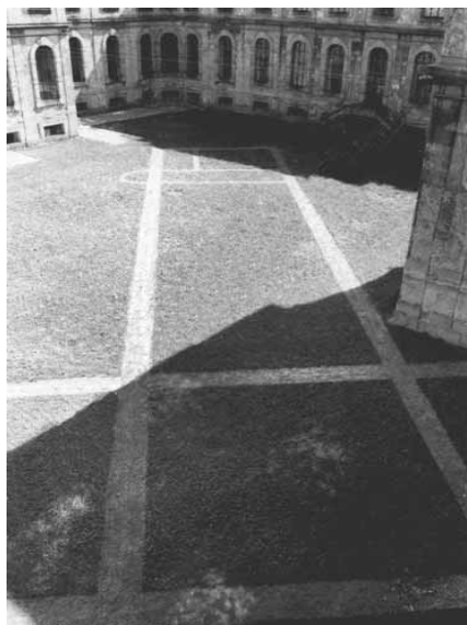
J. Vlček, landartová akce – Plasice 2002 – viz text

Jan Vlček (1979), studia na Slezské univerzitě (fotografie), FaVU VUT (grafika, environment), stáž na univerzitě v Bilbau, účastník putovní výstavy Cirkus umění (2004-6), 3 výstavy v rámci festivalu Uši a Vítr.