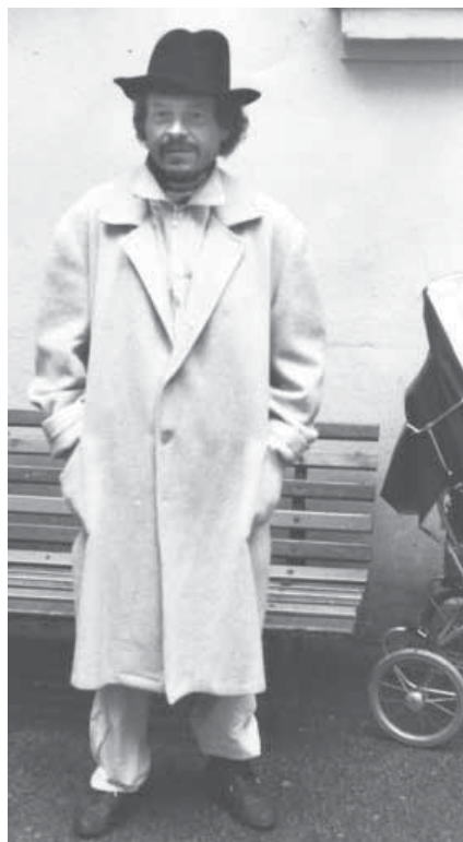
V Úraz. nemocnici, duben 1993