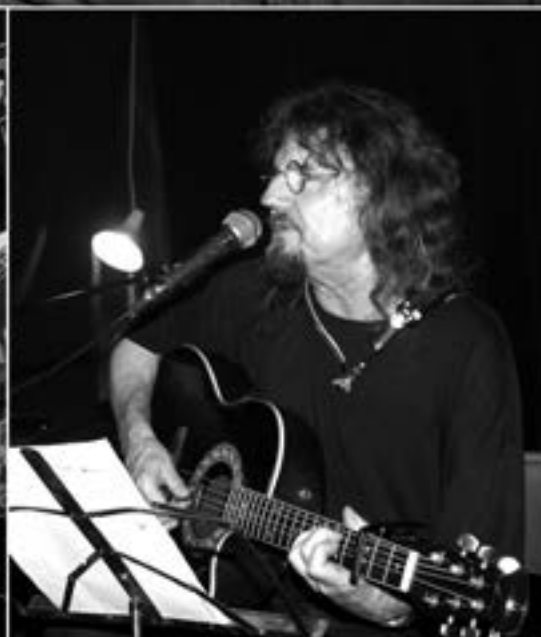
MIROSLAV SKALÁK SKALICKÝ TESILOVÁ VERBEŽ Pulchra 2013, kniha, 264 stran Skladby Skalákovy skupiny The Hever & Vazelína Band Červený vejložky