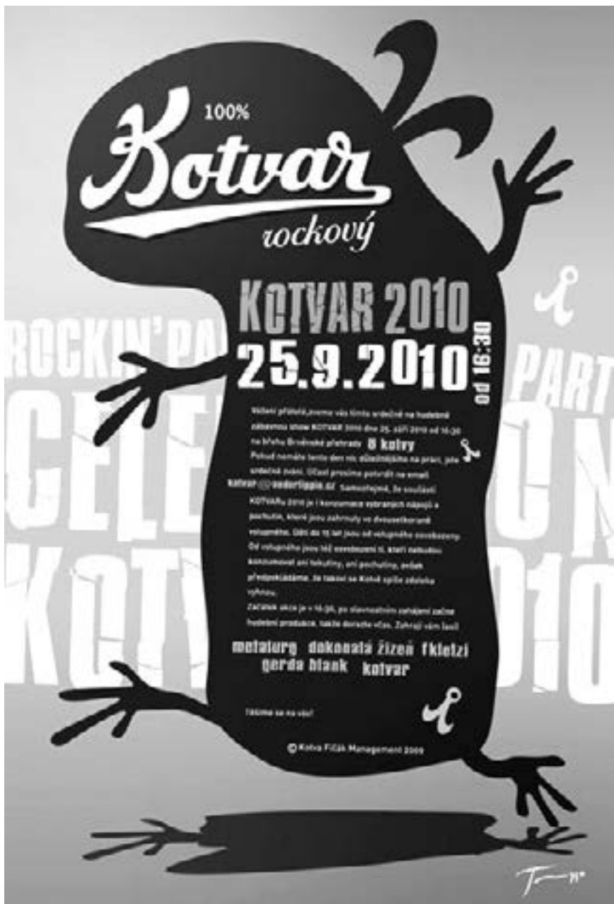
Plakát z dílny studia Pyramide zvooucí na festival Kotvar 2010.

moc vážně, 3 ze 4 ročníků byly ukončeny vždy až příjezdem policie – to jsou úspěchy. Neúspěchy – stále se to nedáří ukočírovat finančně, různě hluboké díry lepím sám, s pomocí zúčastněných kapel, hospodských a podobně. Klasika. No a taky jsem třeba poslední ročník podcenil propagaci, takže byt se tam otočilo tak 300 lidí, vypadal ten obrovský prostor parkoviště dost bezútešně prázdně. Ale pokud neskončím na pracáku, v pakárně, nebo jiném zařízení, s nějakými změnami to bude příští rok zase. Chtěl bych ale určitě udržet to různé hudební zaměření kapel. Nic nemiluju víc, než když na sebe pak Víta z Metalurgu s Gramem z We Know hulákají co to proboba hraje za přišerýj sráčky? Přijdeš?