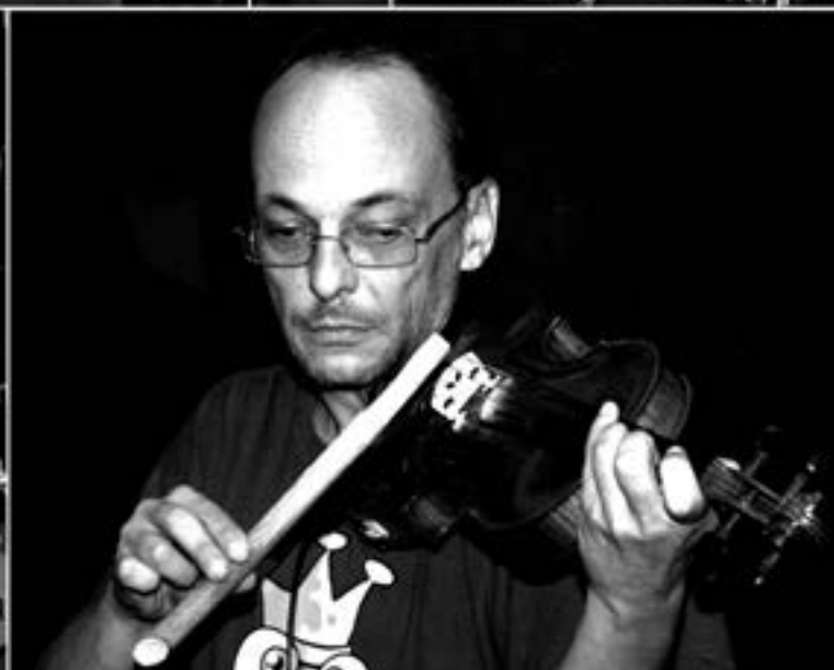
Festival Napříč – Konec léta u Skaláka na mlýně, 30. – 31. srpna 2013, Mezříčko u Želetavy