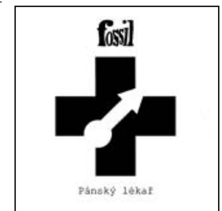
FOSSIL PÁNSKÝ LÉKAŘ Pidimužik, 2013, CD Hudební produkce skupiny se těžce

vměstná do jakékoliv škatule a všechny dosavadní pokusy o seriózní charakteristiku tvorby Fossilu skončily nezdarem (např. hipisácký cirkus s jazzovým feelingem a punkovou energií či zábavová psychedelie obohacená o netradiční postupy a okořeněná černým humorem a notně neurotickými klávesami). Nedílnou součástí skladeb jsou texty, které obstojí i samostatně jako hořce veselá inteligentní poesie. Havířovský psychedelický band po dlouhých letech vydal další fošnu. Plocha 49 minut originální hudby s neotřelými texty a rovněž i PC přílohu se spoustou zajímavého materiálu.