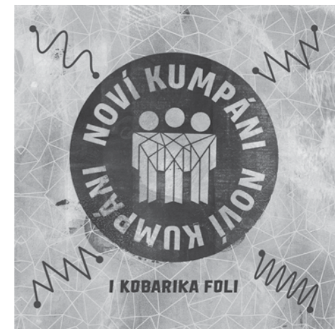
CD NOVÍ KUMPÁNÍ, I kobarika foli Ears & Wind Records, 2024 K dostání na www.drevenacikada.cz

Máš ještě něco na srdci? Co tě zajímá v životě? Jak vidíš budoucnost Nových kumpánů? Jaké máš hudební či životní vzory?