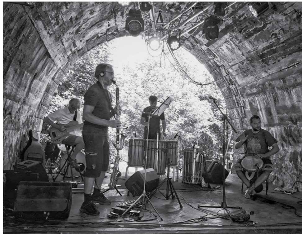
Noví kumpáni v ruinách Hitlerovy dálnice. Festival Krákor 2022, Ostopovice u Brna.

Měla s tím opravdu moc práce, fotky musíš na počítači hodně upravovat, aby byly dostatečně kontrastní, protože ten tisk pak nefunguje dobře a tiskne to lidi třeba bez hlavy, nebo ruky. Bláhově jsem si myslel, že nahrát to album bude to nejpracnější.