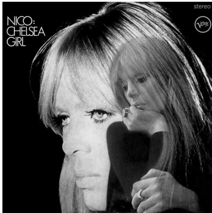
Obal legendární desky Nico: Chelsea Girl, Verve Records 1967.

Chelsea Girl je prvním sólovým albem Nico a vyšlo rovněž roku