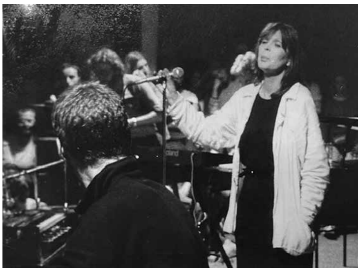
Říjen 1985, kulturní centrum Na Opatov, Praha.

Na přelomu 50. a 60. let se prosadila i jako herečka – hrála například ve filmu Sladký život (La Dolce Vita, 1960) italského režiséra Federica Felliniho. Později hrála i v několika filmech Andyho Warhola (1966–1967), Jacquesa Poitrenauda (1963) či Philippa Garrela (1972–1979). Bydlela zpravidla ve Francii, ale také ve Španělsku, Švýcarsku, Rakousku, a hlavně na Ibize, která jí přirostla k srdci nejvíce.