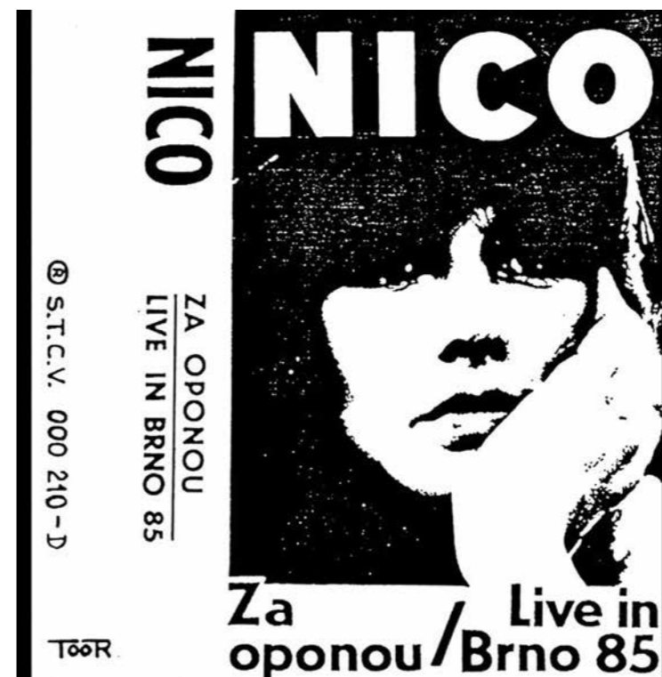
Původní obal kazetové reedice brněnského vystoupení. S.T.C.V 1985.