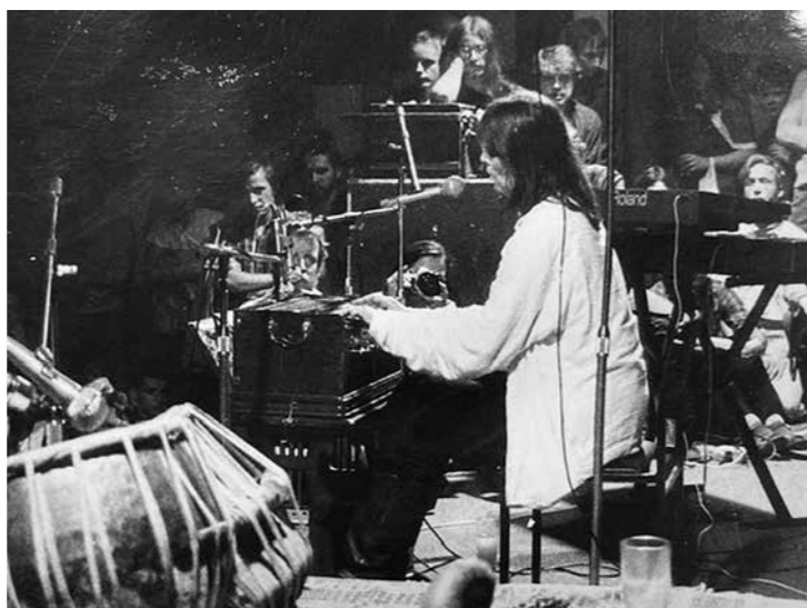
Říjen 1985, kulturní centrum Na Opatov, Praha.